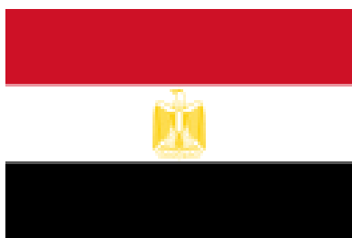
сл. 1 застава Египта

Република у североисточној Африци и југозападној Азији ( Синај ), с обалама на Средоземном и Црвеном мору. По површини 29, а по броју становника 17. од 195 држава света. Званичан назив је Арапска Република Египат, у којој је облик владавине председничка република и званичан језик је арапски. Египат је претежно пустињска земља у којој наплавна долина Нила с делтастим проширењем чини само 3% површине. Западно од Нила налази се већа Либијска пустиња са неколико депресија, на истоку је мања и виша Арапска пустиња, а на североистоку у азијском делу земље планинско-пустињско полуострво Синај. Клима је претежно пустињска с врло мало падавина које се смањују од обале Средоземног мора ка унутрашњости. Нил је једина стална река јер се храни водом у планинском тропском подручју богатом кишима. Плодна долина и делта реке имају карактеристике највеће и најнасељеније оазе у свету, где живи више од 98% становништва ове земље. Велика већина су Арапи, углавном сунитски муслимани; хришћана (Копти) има око 10%. Египат је најмногољуднија и друштвено најутецајнија арапска држава, иако економски заостаје за земљама богатим нафтом. Највећи економски значај има река Нил, у чијој се долини и делти добија по неколико жетви годишње. Велики значај има и морски пут кроз Суецки канал. Египат је водећа афричка држава по девизном приливу од туризма (атрактивне грађевине и стари споменици фараонског Египта).